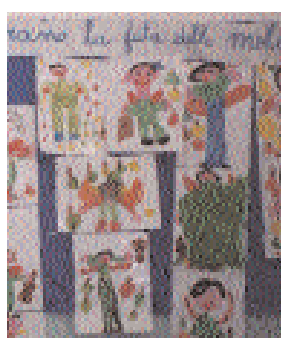
Attività di animazione nelle scuole Melanch'io. Elaborati, disegni dei bimbi delle scuole materne