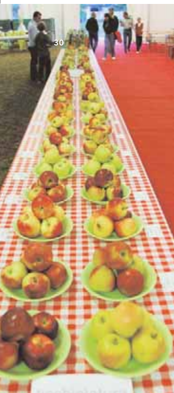
Mostra delle mele autoctone durante la 34ª Mostra Concorso della mela di Pantianicco del 2003

La mela è un prodotto semplice e alla portata di tutti, ma è anche molto duttile e vario nei suoi utilizzi: in cucina dove si può trasformare in molte altre cose (marmellate, torte, frittelle) o se lavorato in succo, sidro, mele essiccate... Con Melanch'io attraverso la scoperta del gusto delle tante varietà di mele commerciali e autoctone, anche biologiche della regione, i bimbi potranno accorgersi che le mele hanno diverse varietà, diversi sapori e diverse consistenze e potranno assaggiare anche la mela trasformata.